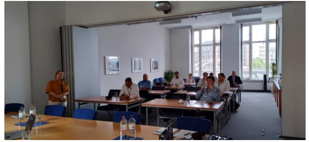
Impressionen einer von SBS organisierten Informationsveranstaltung in Hamburg

Eine Übersicht zu weiteren Projekten des Markterschließungsprogramms für KMU des Bundesministeriums für Wirtschaft und Klimaschutz können Sie unter www.gtai.de/mep abrufen.