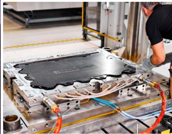
Herstellung einer Bodenplatte