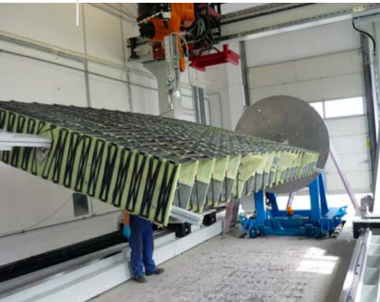
C-BAR Kurzschnittfaser Betonteil