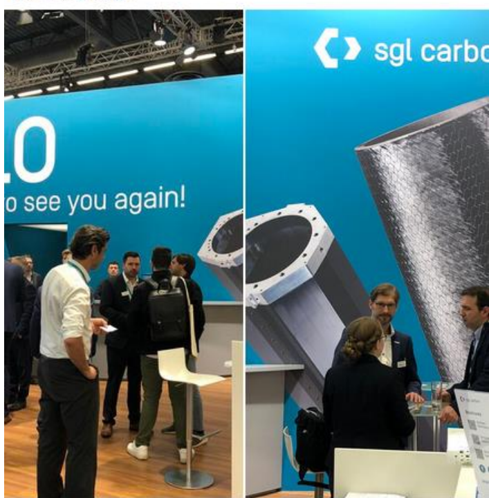
Sven Blanck und 61 weitere Personen

'HELLO Great to see you again!': SGL Carbon's two business un ... mehr anzeigen Übersetzung anzeigen